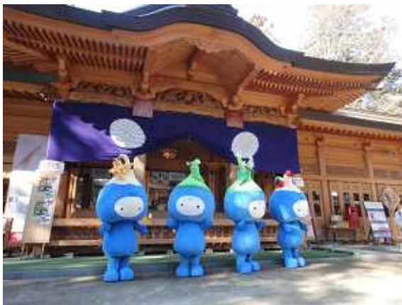
穂高神社拝殿前での記念撮影