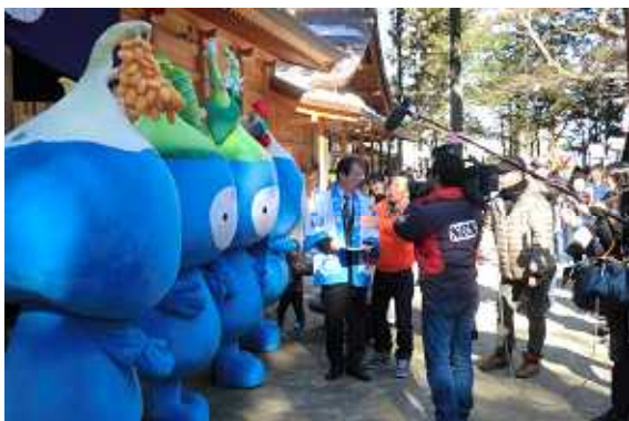
地元テレビ局の取材もあり、拝殿前は 大騒ぎ状態