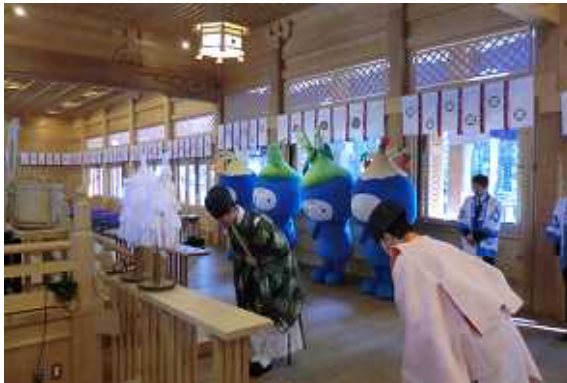
穂高神社拝殿で参拝する農産物の妖精たち